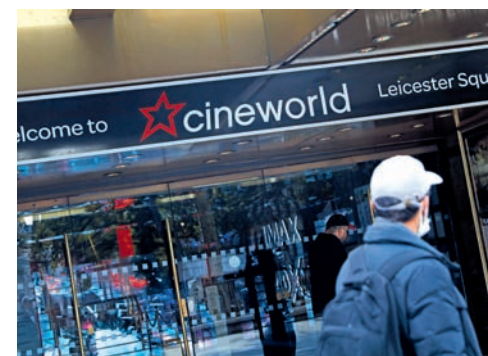
Un hombre pasa frente a las salas de Cineworld en Londres.

Los productores de la nueva película de James Bond "No Time to Die" anunciaron que debido a la pandemia el estreno fue postergado hasta abril de 2021.